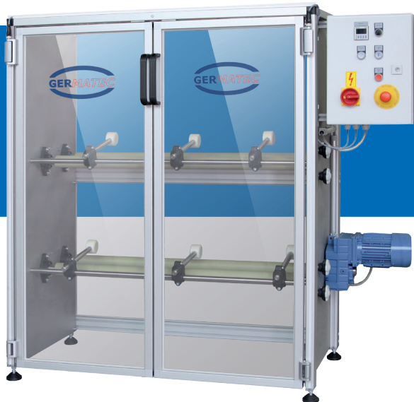
Typ/Type - TPR-D

Topfroller zur Nass- und Trockenvermahlung sowie zum Mischen unterschiedlicher Materialien in geeigneten Rundbehältern aus Porzellan, Kunststoff, Stahl, Edelstahl oder ähnlichem.