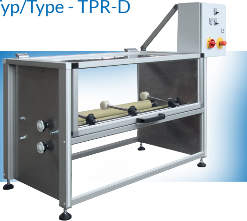
Typ/Type - TPR-D

Topfroller zur Nass- und Trockenvermahlung sowie zum Mischen unterschiedlicher Materialien in geeigneten Rundbehältern aus Porzellan, Kunststoff, Stahl, Edelstahl oder ähnlichem.